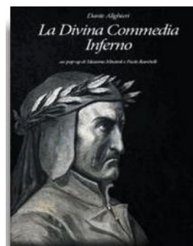
Massimo Missiroli Paolo Rambelli «La Divina Commedia. Inferno» Missiroli pp. 30 pop-up, € 20