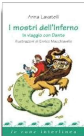
Anna Lavatelli «I mostri dell'Inferno» Interlinea pp. 64, € 10