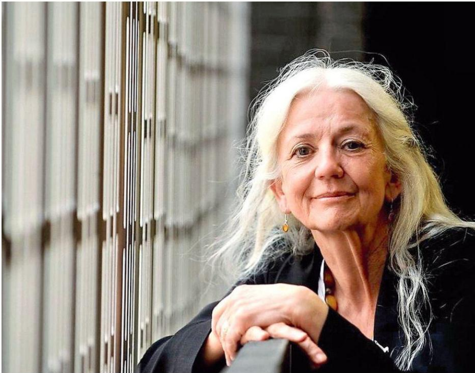
La poetessa irlandese Paula Meehan è la vincitrice del Premio «Città di Vercelli» del Festival di Poesia Civile