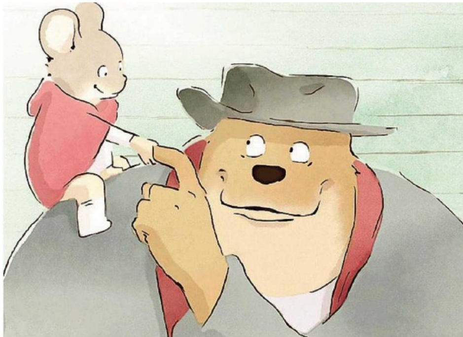
Dal film "Ernest e Celestine - L'avventura delle 7 note" di Jean-Christophe Roger e Julien Cheng

Un regalo speciale che potrà fare da collante in famiglia, grazie all'ascolto da condividere e dividere su più giorni. (Locomotavia, 18 euro).