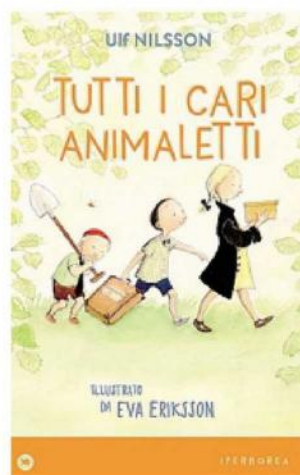
"Tutti i cari animalletti"