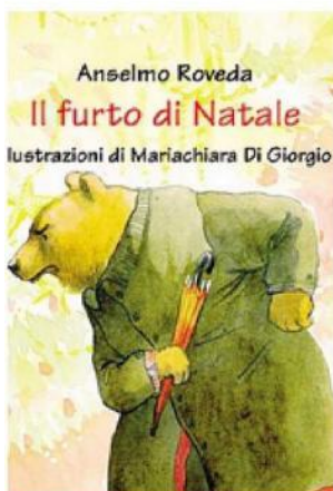
"Il furto di Natale"